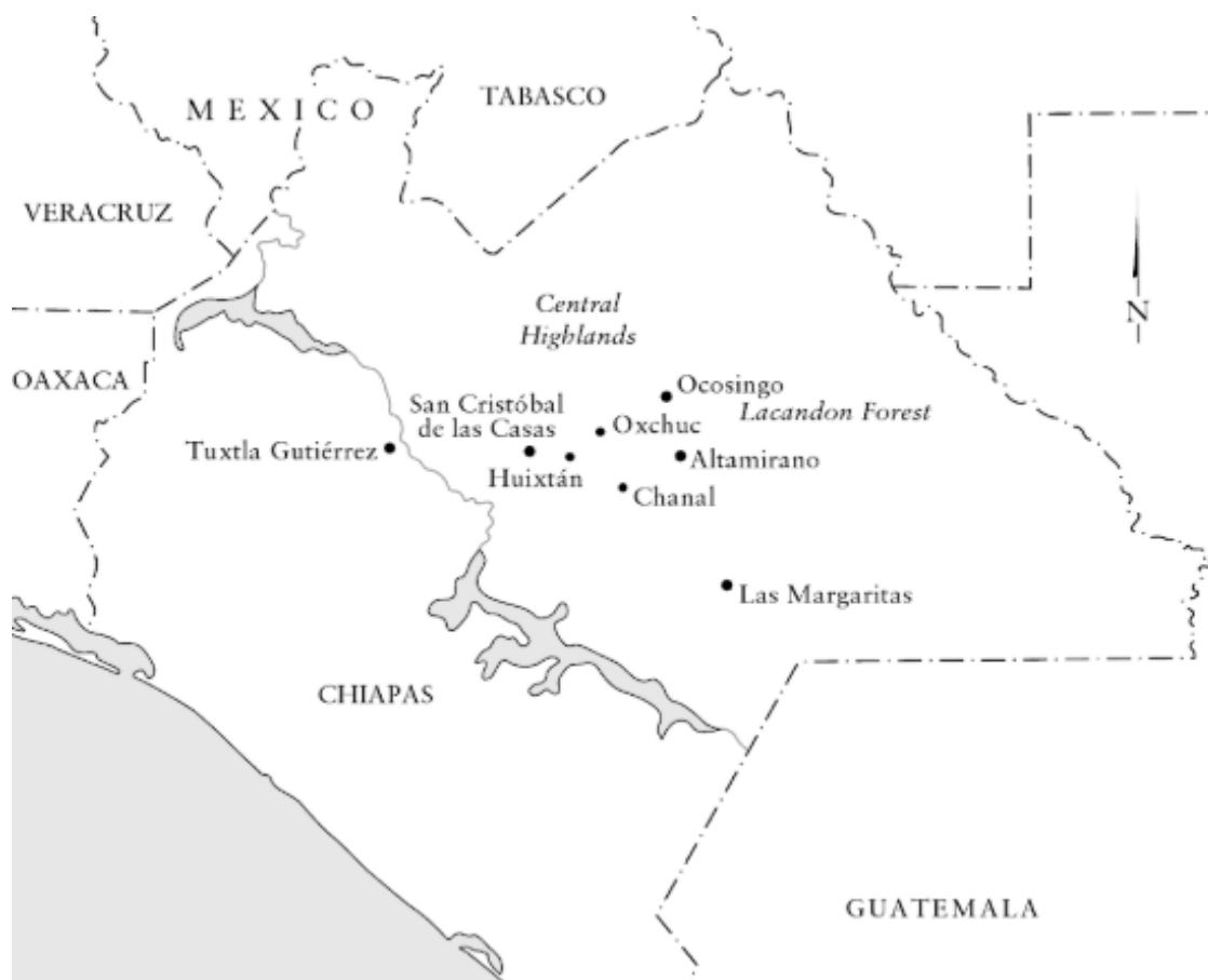
Figura 1 – Mapa de Chiapas no México com as cidades conquistadas pelo levante de 1 de janeiro de 1994.