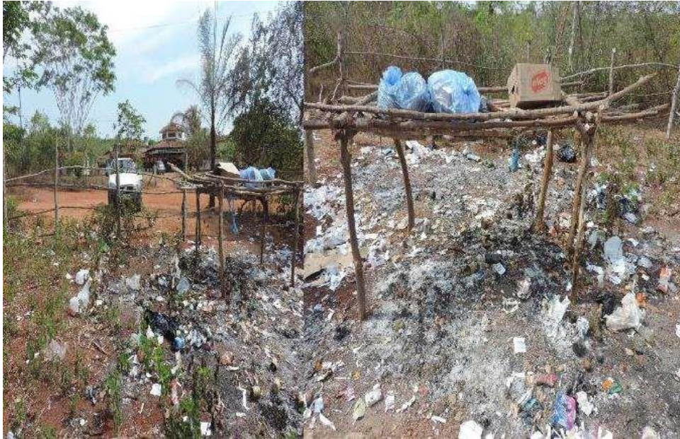
Figura 09: local destinado a colocar os resíduos sólidos utilizados na escola Estadual Mãtyk/aldeia São José