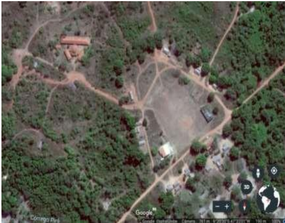
Fotografia 02: Imagem aérea da aldeia São José