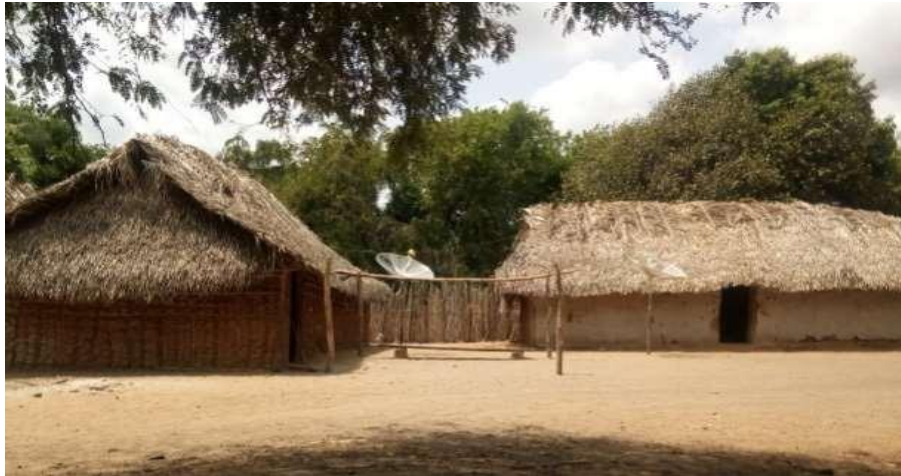
Figura 04: A esquerda Casa do Cacique Luiz Dias Sousa Apinayé e a direita casa do Sr. Davi Wamimen Chavito Apinagé na aldeia São José no município de Tocantinópolis- TO.