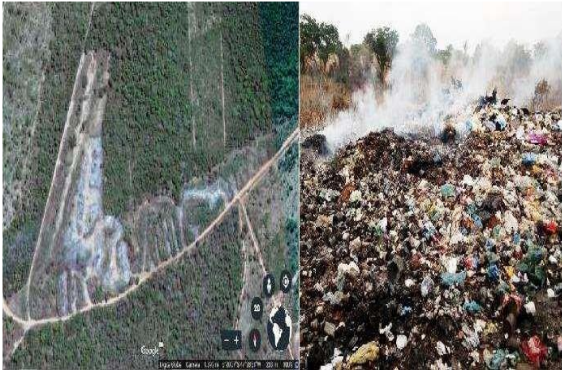
Figura 08: lixão de Tocantinópolis - TO. Primeira foto retirada da internet