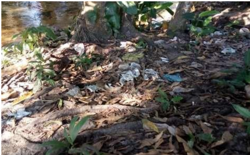
Figura 10: Margem do ribeirão São José com os lixos mencionados no texto

Fonte: Silva, Jéssica Adriana dos santos. 10/06/2018.