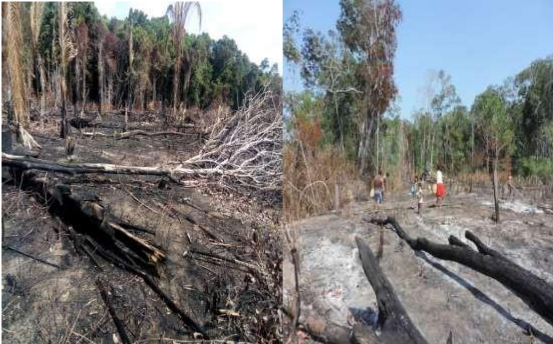
Figura 07: roça de toco indígena no processo da limpeza.