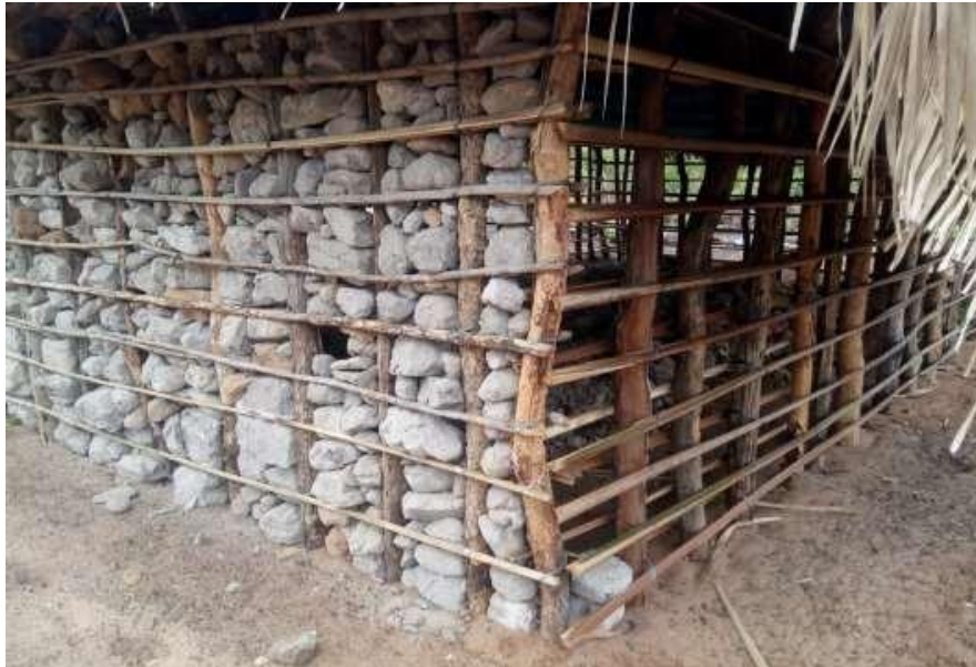
Figura 03: Casa dos povos indígenas Apinayé em processo de construção no município de Tocantinópolis - TO.