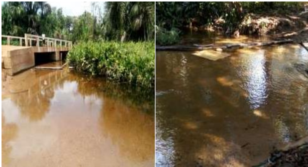
Figura 05: Ribeirão São José

Fonte: Silva, Jéssica Adriana dos Santos. 18/09/2018.