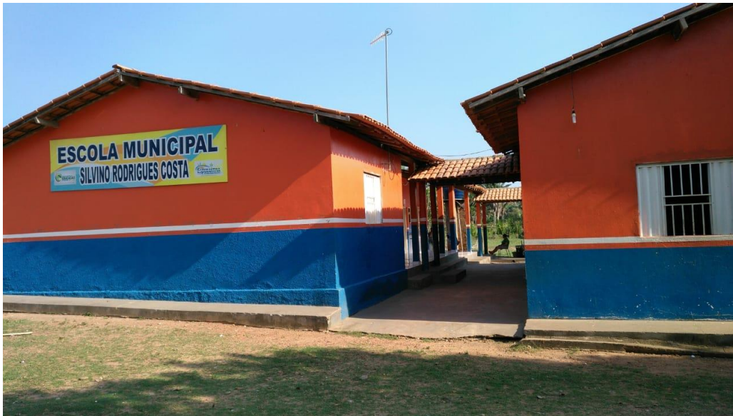
Imagem 1. Escola Municipal Silvino Rodrigues Costa