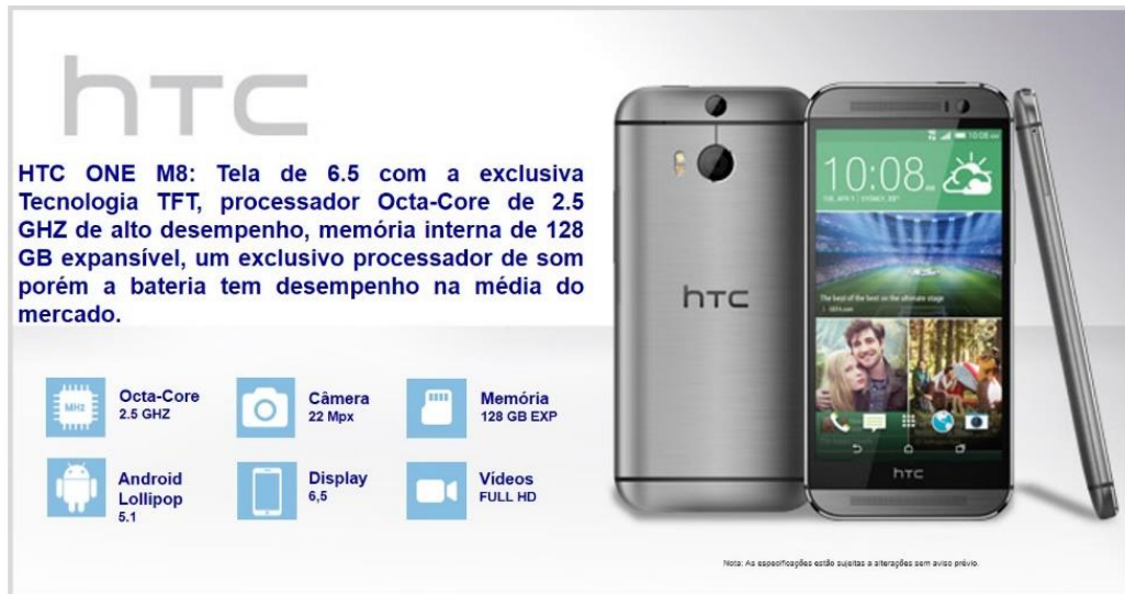
Figura 3 - Propaganda com Mensagem Two Sided

Foram elencados três atributos positivos e um atributo negativo do aparelho nesta mensagem.