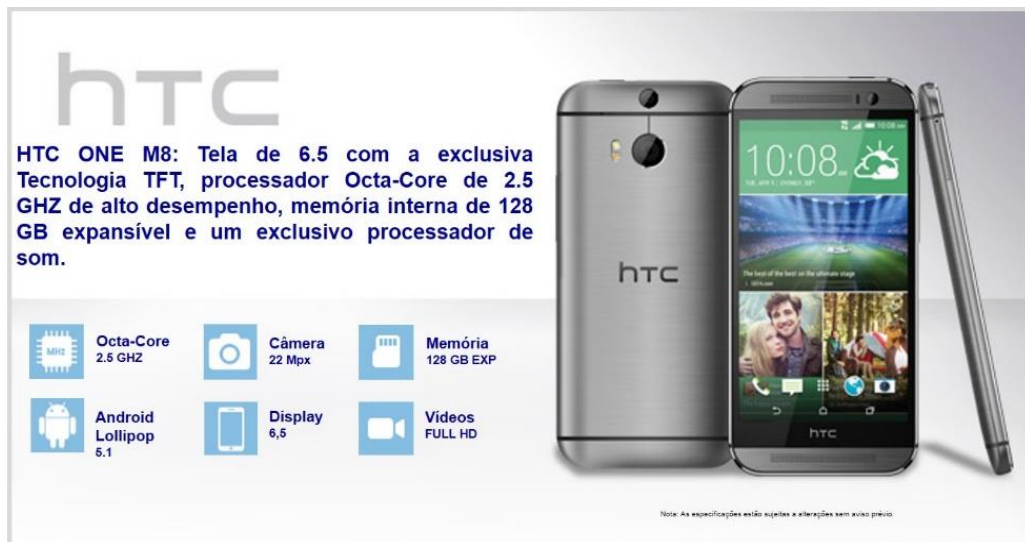
Figura 2 - Propaganda com Mensagem One Sided

Nela, foram expostos somente atributos positivos do aparelho.