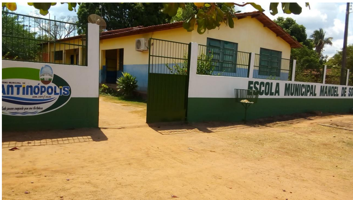
Imagem 1 – Foto da Escola Municipal Manoel de Sousa Lima