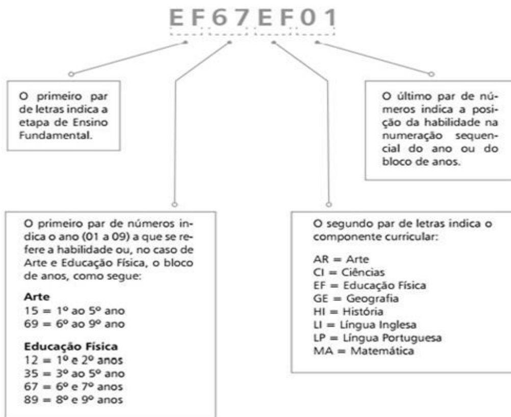
Figura 2 - Código EF67EF01, por exemplo, refere-se à primeira habilidade proposta em Educação Física no bloco relativo ao 6º e 7º anos.