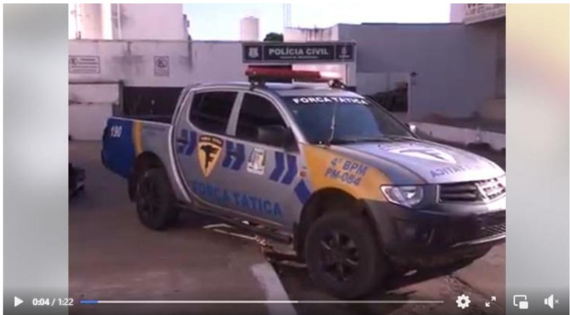
Força Tática prendeu homem de 35 anos de idade por tráfico de drogas ...

A reportagem analisada é parcial e tem diversas palavras truncadas, que não devem ser de uso comum para uma reportagem. Além disso não se ouve mais que uma fonte, como em todas as outras narrativas analisadas este estudo. Nesta reportagem, a começar pelo Título, a narrativa começa falando da ação policial: Força tática prendeu homem de 35 anos de idade . Observa-se que a reportagem tem um critério básico de noticiabilidade, que é de narrar ações