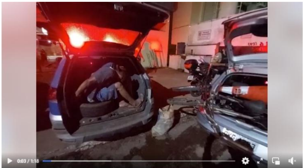
Dois homens foram presos enquanto furtavam fiação de rede pública e...