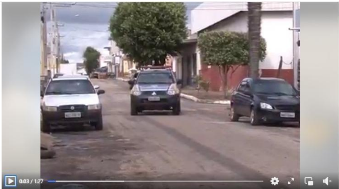
Força Tática prende homem de 44 anos de idade por tráfico de drogas, ...