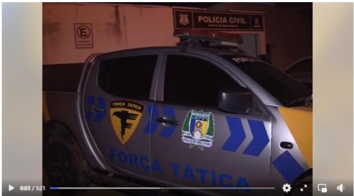
Polícia Militar prende homem em flagrante por tráfico de drogas em Gu...

No Título, a narrativa prioriza a informação polícia, ao iniciar a manchete dizendo: Polícia prende homem . Além disso, a PM é a única fontes utilizada na reportagem. Os