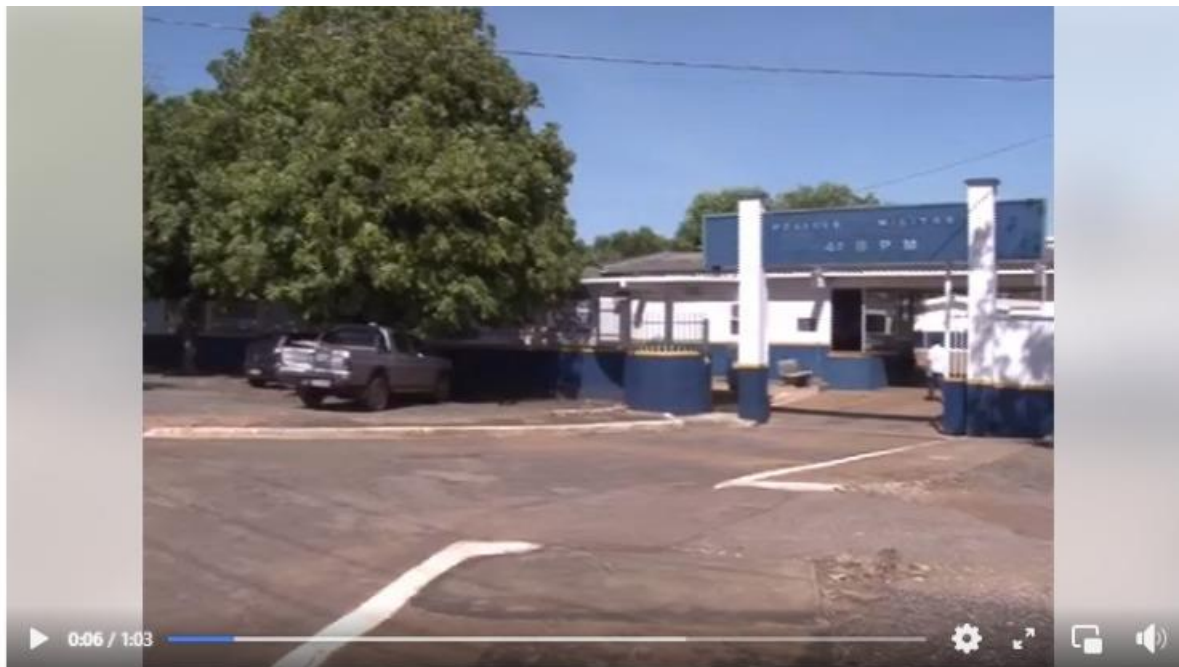
polícia militar prende homem por posse ilegal de arma de fogo e muniç...

O quadro 3, ilustra de forma objetiva uma análise do que a reportagem traz. O “dito” composto no Título, dá destaque mais uma vez a uma narrativa do “bom” trabalho da polícia. A PM vem em primeiro plano e o que ela fez, reforça o conceito que a narrativa tem a missão