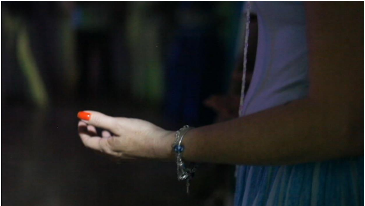
Imagem da web-série documental “Umbanda é nosso axé”

A ideia inicial era desenvolver um produto documental único sobre a Umbanda na cidade de Palmas, mas o projeto foi se modificando ao longo dos meses, principalmente por conta da pandemia da Covid-19, e alguns ajustes e modificações tiveram que ser feitos. Algumas entrevistas foram inviabilizadas, as visitas a diversos terreiros foram proibidas, giras e sessões de atendimentos foram suspensas. Assim, optou-se pelo formato web-série documental, pois as gravações da Tenda de Umbanda Caboclo Sultão da Mata e Pai João de Aruanda já haviam sido realizadas. Dessa forma, não se caracteriza como um produto institucional e, ainda assim, cumpre-se o objetivo central proposto de dar visibilidade à Umbanda em Palmas e contribuir para o fim do preconceito.