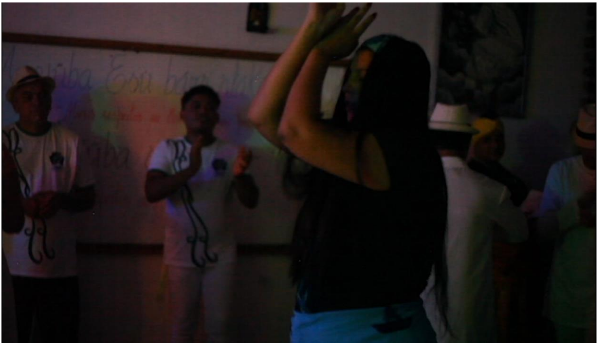
Imagem da web-série documental “Umbanda é nosso axé”

A web-série, que ficará disponível na plataforma do YouTube, poderá ser acessada por toda a população que buscar conhecer mais sobre a Umbanda, que tiver a curiosidade e a vontade de se abrir para esse, ainda, ‘desconhecido’. A linguagem da web-série foi pensada para atingir pessoas de várias idades, de simples entendimento, para que a informação fique acessível para além da bolha universitária, alcançando pessoas desde o nível de escolaridade mais baixo. Em especial, a web-série busca os olhares de jovens, jovens adultos e adultos, que não tenham fechado completamente suas mentes para o diferente.