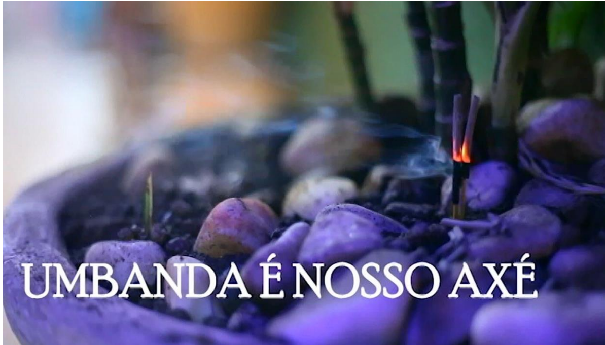
Imagem da web-série documental “Umbanda é nosso axé”

Apesar de ter sido batizada na igreja católica e ter crescido em uma família muito conservadora e religiosa, sempre foi cobrada à produtora da web-série uma conexão com a igreja, algo que nunca conseguiu alcançar. Somente em sua fase adulta, finalmente, conseguiu fazer as pazes com a religiosidade e encontrar um lugar que a aceitasse e acolhesse. Por isso, além dos motivos apresentados, este projeto se apoia em bases particulares que, por si só, já o torna justificável, como forma de reconhecimento e gratidão àqueles que acolhem na fé.