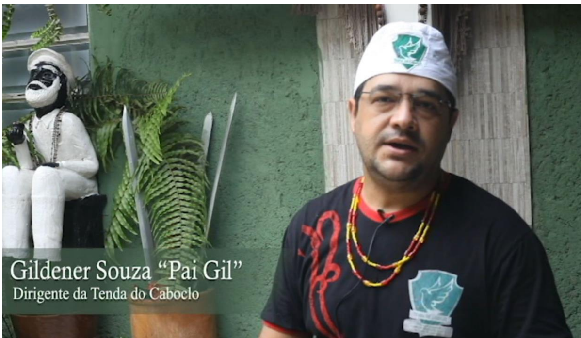
Imagem da web-série documental “Umbanda é nosso axé”