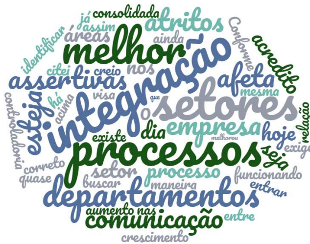
Figura 9- Nuvem de palavras mudanças na interação entre os setores após a implantação da controladoria