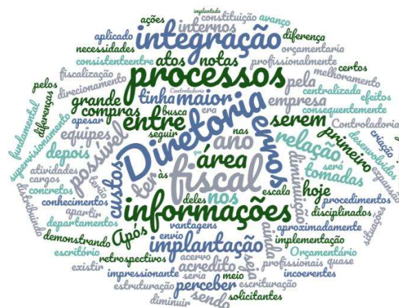
Figura 3- Nuvem de palavras diferenças entre antes e depois da implantação da controladoria na empresa ABC)

Para essa questão muitos colaboradores citaram principalmente as palavras “ diretoria, fiscal, processos e integração ”, conforme apresentado na figura 3.