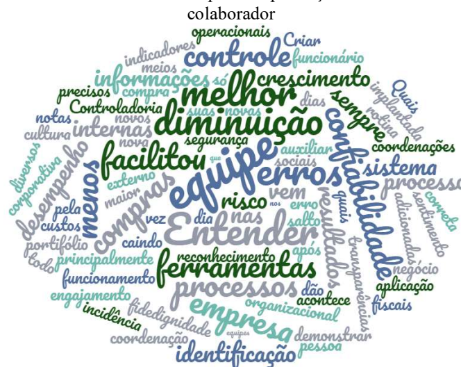
Figura 6- Nuvem de palavras melhorias elencadas após a implantação da controladoria no setor de atuação do colaborador

Quando questionados sobre as melhorias após a implantação da controladoria as principais palavras foram “equipe, entender, diminuição, melhor e confiabilidade”, conforme destacado na figura 6.