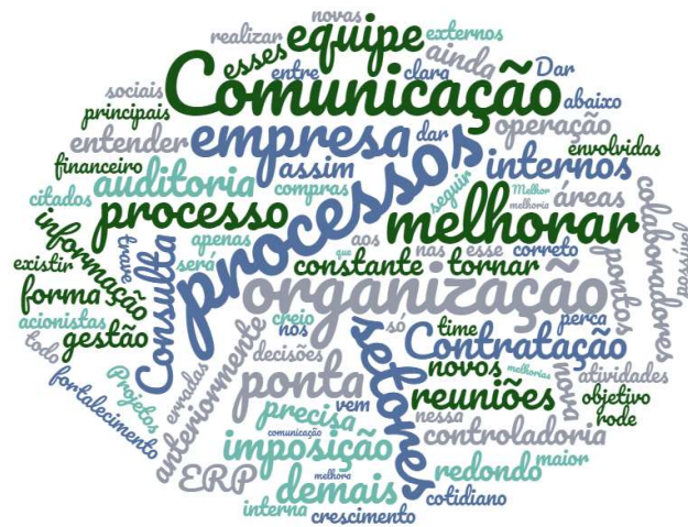
Figura 10- Nuvem de palavras pontos de melhora indicados para a controladoria da empresa ABC

Após a implantação da controladoria e o constante processo de adaptação ainda existem vários pontos a serem melhorados, para essa questão as principais palavras citadas pelos colaboradores foram “melhorar, comunicação, processos e organização”, conforme demonstrado na figura 10.