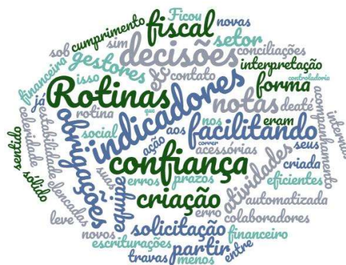
Figura 8- Nuvem de palavras facilidades para o cumprimento das obrigações do departamento após a implantação da controladoria

Quanto as facilidades para o cumprimento das obrigações dos departamentos as principais palavras foram “decisões, rotinas, indicadores e confiança”, para os colaboradores os processos implantados pela controladoria ajudam a monitorar o processo de compras que por consequência geram relatórios mais confiáveis aos gestores, conforme apresentado na figura 8.