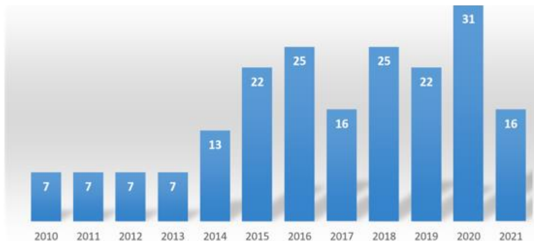
Gráfico 1 - Publicações por ano

Dentre os dados encontrados é importante destacar a quantidade de artigos publicados anualmente, como elucidado no gráfico abaixo.