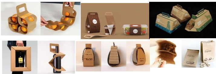
Figura 4: 20 Ideias Práticas e Sustentáveis para Embalagens Take-out .

As Embalagens sustentáveis e práticas (FIGURA 4) estão tomando espaço cada vez mais no mercado, substituindo o plástico e o isopor, já que são embalagens feitas de matérias recicláveis biodegradáveis capazes de transportar bebidas, frutas, ovos, amendoins, ração, entre outras mercadorias.