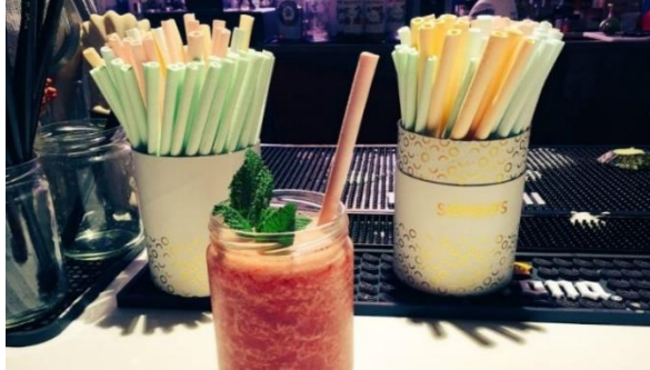
Figura 7: Canudos Comestíveis.

Os Sorbos ao entrarem em contato com as bebidas geladas ou em temperatura ambiente resistem por 25 minutos sem se dissolver. Depois de usar o cliente pode consumir o canudo que é feito de gelatina, açúcar e amido, nos sabores limão, canela, lima, maçã-verde, chocolate, gengibre e morango. Ou caso seja descartados ele é um canudo biodegradáveis que causa menos impacto ao meio ambiente (CAMARGO, 2017, p. 1).