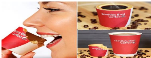
Figura 8: Copos de Café Comestível.

Como os canudos citados acima na figura 7, os copos de café comestíveis (FIGURA 8) também sofram criados para reduzir o impacto de lixo ao meio ambiente e são feitos de uma bolacha de açúcar revertida em papel que por dentro é forrada de chocolate branco que é resistente ao calor. “O chocolate foi criado para derreter e dissolver a bolacha da qual o copo é feito” (ROSENBERRY, 2015, p. 1).