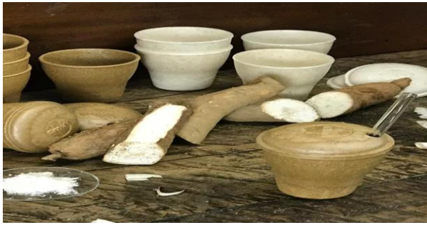
Figura 3: Embalagem de Mandioca.