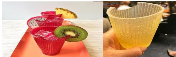
Figura 6: Copos comestíveis feitos de algas.

Tendo a resistência, textura e uma capacidade semelhante ao papel-filme. Além de comestível essas embalagens podem ser usada como tempero para os alimentos, adubos para plantas, caso o não use ela para o consumo, o consumido pode descarta este de duas formas, ele pode dissolver o plástico na água e descarta pela pia que ela será tratada na rede de esgoto naturalmente, ou descarta no lixo, pois a embalagens se decompõe em poucos meses e vira adubo, e não causara nenhum impacto para o meio ambiente (MATTOSO,2016. p. 1).