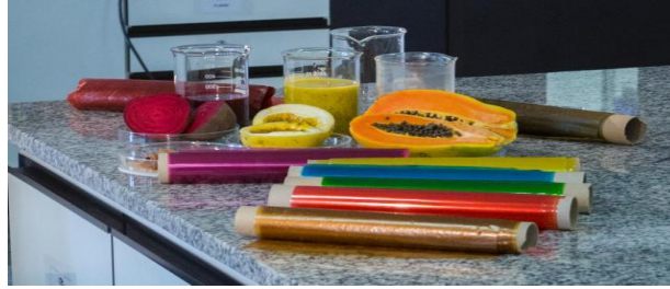
Figura 5: Embalagens plásticas Comestíveis.