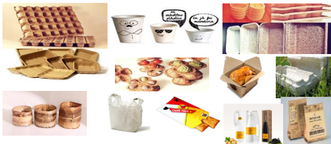
Figura 1: Exemplos de Embalagens Sustentáveis.

As mesmas estão em diversas formas e cores, feitas com diversos materiais alguns citados nos textos acima. Essas embalagens além de reduzir o impacto ambiental ajudam na adubação do solo e não causam risco aos animais, podendo ser descartadas em qualquer lugar, são embalagens criativas e que despertam a curiosidade dos consumidores, e para quem se preocupa com o meio ambiente chega a ser uma ótima ideia, e trazendo uma sensação de paz a estas. ( FONTE) A Figura 1 exemplos de embalagens sustentáveis.