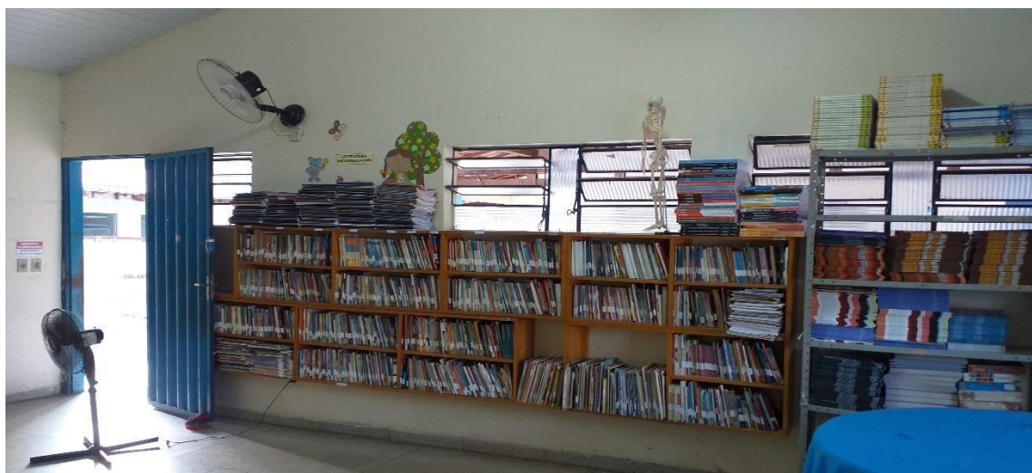
Figura 4 - foto da biblioteca da UE