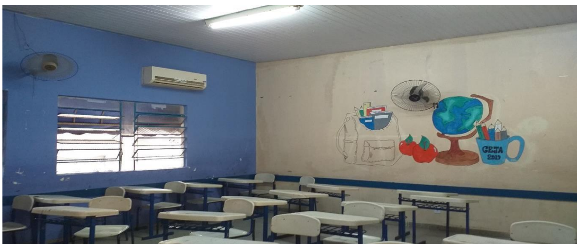
Figura 2 - Foto da sala de aula da UE pesquisada