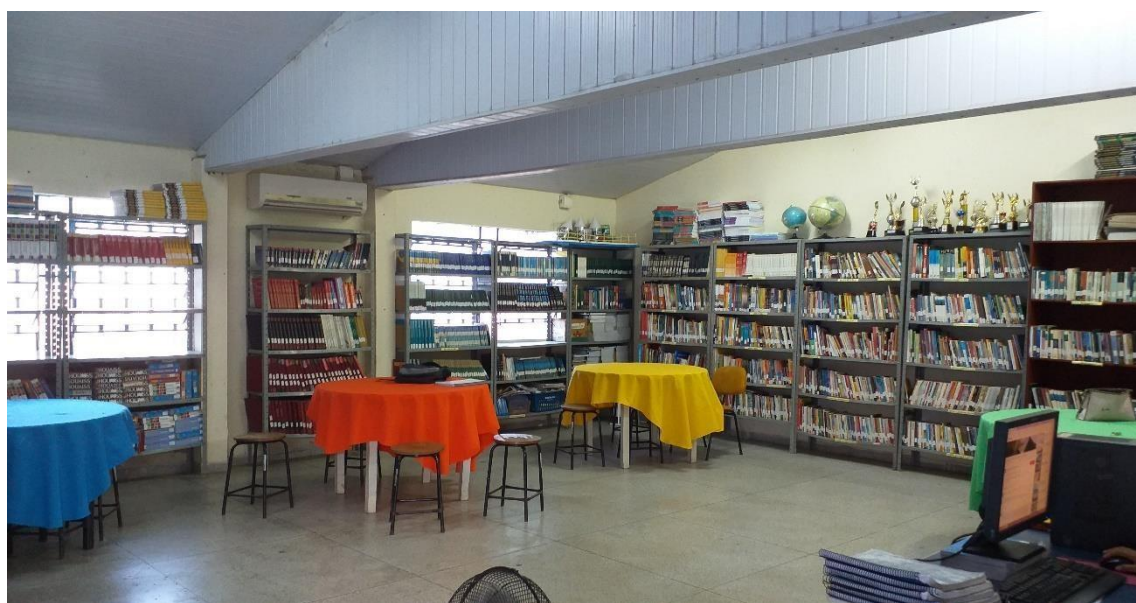
Figura 3 - foto da biblioteca da UE

O colégio possui um laboratório com 20 computadores, mas apenas 6 funcionam, e uma biblioteca com livros diversos para atender as necessidades pedagógicas e administrativas da unidade, no entanto, a biblioteca é muito fechada, pouco arejada e possui apenas um ventilador. Tais questões desfavorecem as atividades praticadas neste ambiente e, implica diretamente, o ensino de leitura, sendo que este é um dos únicos locais que a unidade tem para desenvolver aulas diferenciadas fora da sala de aula. A falta de ampliação deste local deixa o incentivo à leitura a desejar, por não propiciar ao aluno estímulos voltados à prática de leitura. Seguem as fotos da biblioteca da UE.