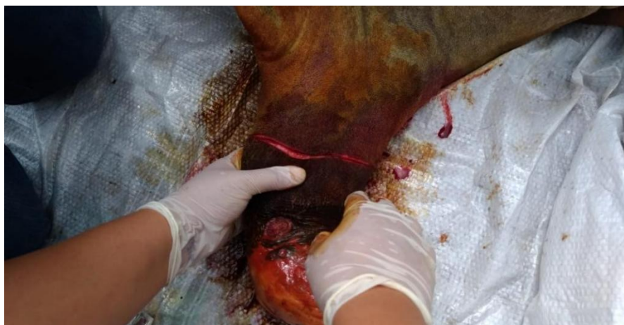
Figura 4: Técnica de circuncisão prepucial em bovino.

Após esses procedimentos iniciou-se a cirurgia reparadora com amputação da porção lesionada. A técnica cirúrgica utilizada foi a de circuncisão (figura 3), com remoção da área atingida e fixação da mucosa prepucial ao óstio por meio de sutura em padrão simples. Realizou-se divulsão, separando a parte cutânea do prepúcio até chegar na uretra e fez-se a tração da mucosa a fim de evitar uma possível torção.