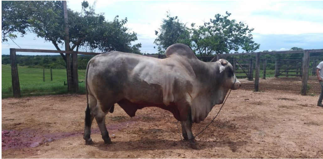
Figura 6: Touro após a cirurgia de robustecer.