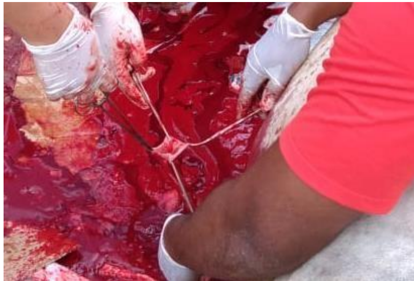
Figura 5: Lâmina prepucial interna seccionada longitudinalmente em quatro partes em formato de “pétala”.

prepúcio. Posteriormente, realizou-se aproximação da mucosa íntegra com a camada cutânea utilizando padrão simples de sutura e fio de algodão. A lâmina prepucial interna foi seccionada longitudinalmente em quatro partes, em formato de “pétala” (figura 4) , e suturada junto à mucosa com fio de algodão.