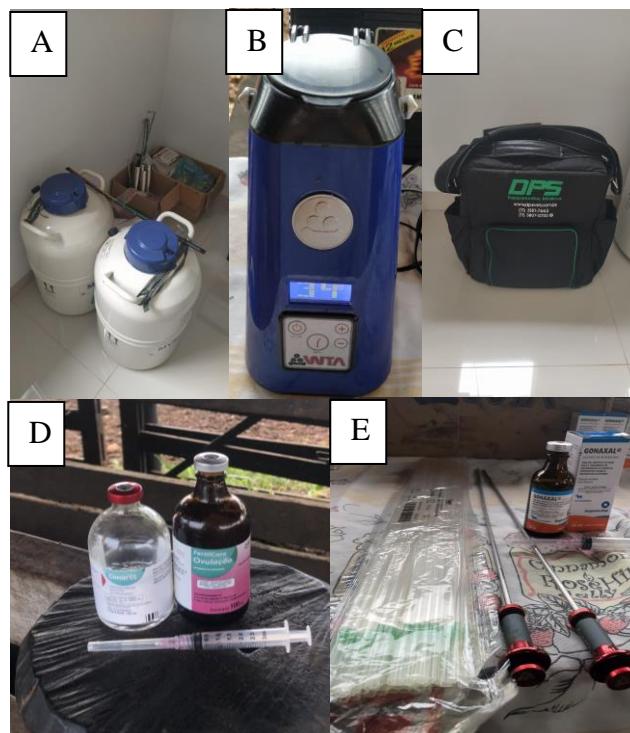
Figura 1. Equipamentos e reagentes utilizados durante as práticas desenvolvidas durante estágio curricular supervisionado obrigatório realizado no período de 19/01/21 a 01/04/21

O supervisor de estágio desenvolve atividades em três propriedades, distribuídas entre os estados do Pará e Tocantins, apresentando como objetivo principal produção comercial de gado de corte. A empresa PROGENE, de propriedade do supervisor, não apresenta um escritório fixo, no entanto a figura 1 apresenta os equipamentos existentes e utilizados no desenvolvimento das atividades exercidas durante o período de estágio. A tabela 1 apresenta as fazendas visitadas durante o período de estágio, com suas devidas localizações (município e unidade federativa).