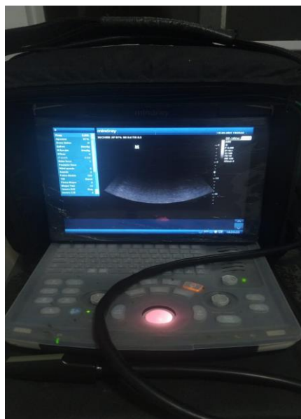
Figura 4. Modelo de ultrassom utilizado durante Estágio Curricular Obrigatório.

Durante o estágio muitas foram as oportunidades de realização de diagnóstico de gestação através da utilização de ultrassom, o modelo utilizado foi (Mindray DP-10VET POWER). Os diagnósticos eram realizados após 30 dias das inseminações ou no início de trabalho de um lote que entraria para um protocolo de IATF, a fim de confirmar que os animais apresentam-se sem a presença de uma gestação.