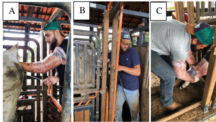
Figura 2. Atividades desenvolvidas durante o período de Estágio Curricular Supervisionado Obrigatório.