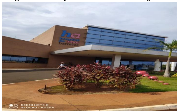
Figura 1 - Hospital do amor infantojuvenil