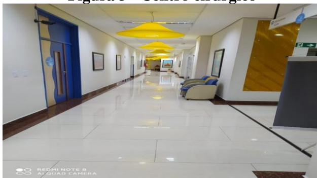
Figura 3 - Centro cirúrgico