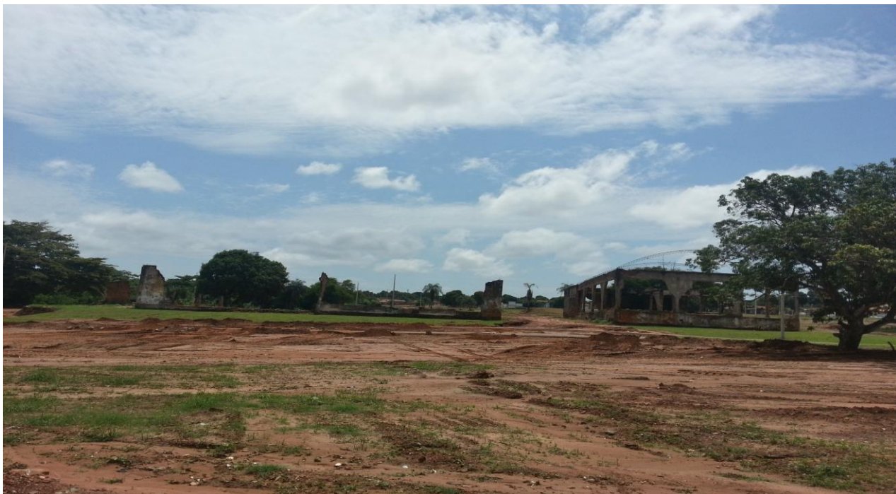
Figura 5 – Restos da estrutura da indústria CIMBA em outro ângulo