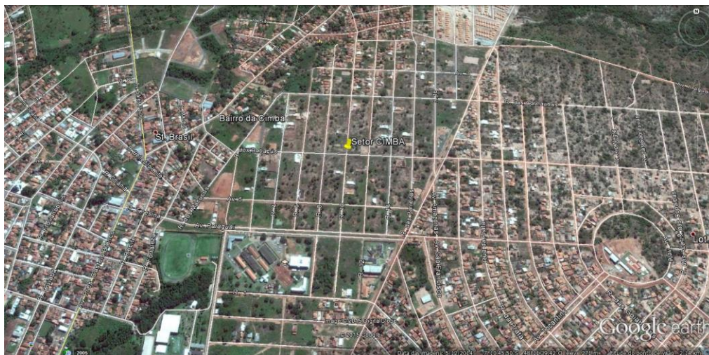
Figura 3 – Imagem de satélite do Setor Cimba