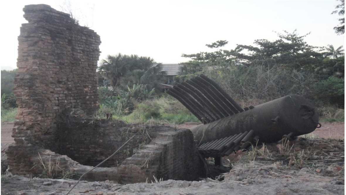
Figura 6 – Restos de equipamentos da caldeira