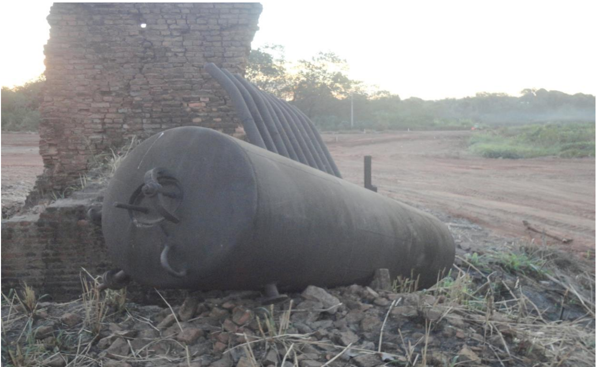
Figura 7 – Cilindro da caldeira da indústria CIMBA