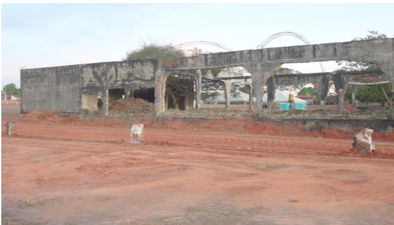
Figura 4 – Restos da estrutura da indústria CIMBA atualmente

A figura nº 4 e 5 a seguir, apresenta a estrutura da indústria na atualidade, considerando que não existe registros fotográficos da mesma na época do seu pleno exercício, embora a sua relevância para a cidade, verifica-se que o registro histórico de Araguaína ainda é bem carente, havendo algumas informações em documentos e acervos das próprias famílias que fizeram parte da formação e construção da cidade (FERREIRA, 2012).