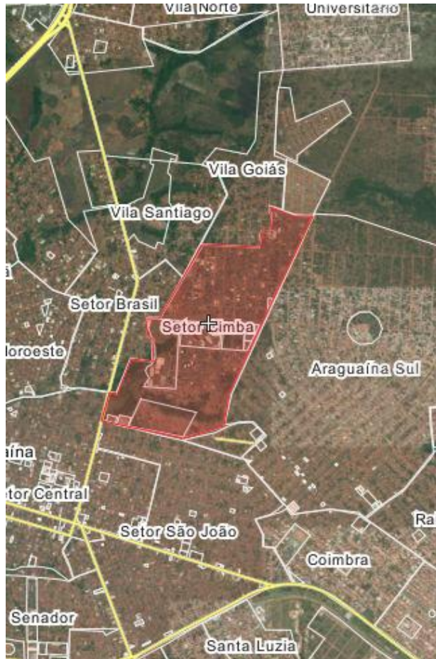
Figura 2 – Mapa geográfico do Setor Cimba em Araguaína – TO

imóveis. A divisão geográfica desse setor é apresentada na figura a seguir que representa o setor e os bairros circunvizinhos (CORRÊA, 2000).