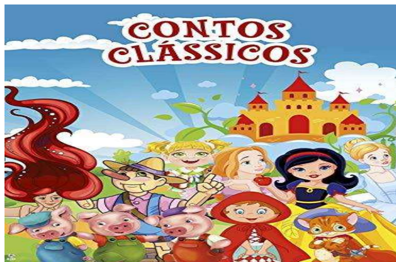
Imagem 06 Contação de história

A contação de histórias contempla o campo de experiência, Escuta, fala, pensamento e imaginação; ajuda a criança a contar e recontar histórias de fábulas ou do cotidiano, a reconhecer personagens de histórias contadas e a planejar roteiros coletivamente.