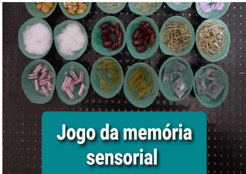
Imagem- 02 Brincadeira jogo da memória sensorial