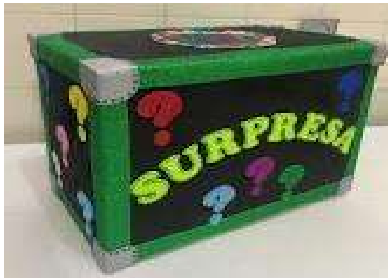
Imagem 5 Brincadeira da caixa surpresa

A brincadeira da caixa surpresa, contempla os campos de experiência Corpo, gestos e movimentos; Traços, sons, cores e formas; possibilita a criança criar com o corpo formas diversificadas de expressão de sentimentos, sensações e emoções, utilização de materiais com possibilidades de manipulação.