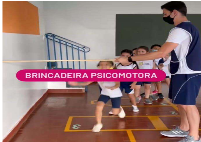
Imagem-03 Brincadeira om cabo de vassoura

Esta brincadeira contempla os campos de experiência O eu, o outro e o nós; Corpo, gestos e movimentos; essa brincadeira ajuda a criança a desenvolver atitudes de participação e cooperação, coordenar as habilidades manuais no atendimento a seus interesses e necessidades.