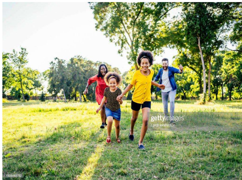
Imagem – 01: Brincadeira Pega-Pega Corrente

Essa brincadeira contempla os campos de experiência O eu, o outro e o nós; Corpo, gestos e movimentos; porque amplia as relações interpessoais, desenvolve a participação, controle e adequação do corpo e a reconhecer o uso das regras nas brincadeiras.