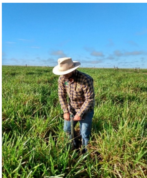
Figura 1. Coleta de amostras de solo com o trado tipo sonda.

A área destinada ao plantio de soja era de 550 ha e, o esquema de amostragem, foi definido dividindo-se as áreas em talhões, e cada talhão possuía uma área de 30 ha. Ao iniciar o estágio, metade da amostragem de solo já havia sido feita. Assim, foi possível realizar a amostragem de solo em um total de 300 ha divididos em 10 talhões (30 ha cada) e cada talhão dividido em 6 glebas. Em cada gleba foram coletados 10 pontos e em cada ponto foram retiradas três amostras de 0-20, 20-40 e 40-60 cm de profundidade e em seguida foi feita uma sub-amostra, que após identificação foi enviada ao laboratório para análise.