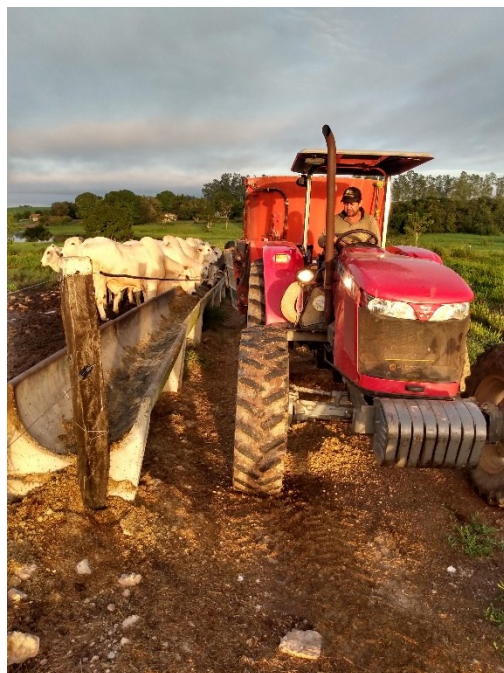
Figura 3. Fornecimento de alimento no cocho.

Os cochos eram arraçoados quatro vezes ao dia, duas vezes no período da manhã as 06:00 horas e 09:00 horas, e duas vezes no período da tarde as 13:00 horas e as 17:00 horas (Figura 3). A quantidade de alimento fornecido variava e dependia do consumo dos animais e da quantidade que sobrava no cocho. O fornecimento de água era feito em bebedouros confeccionados na própria fazenda e a limpeza dos mesmos, realizada uma vez por semana.