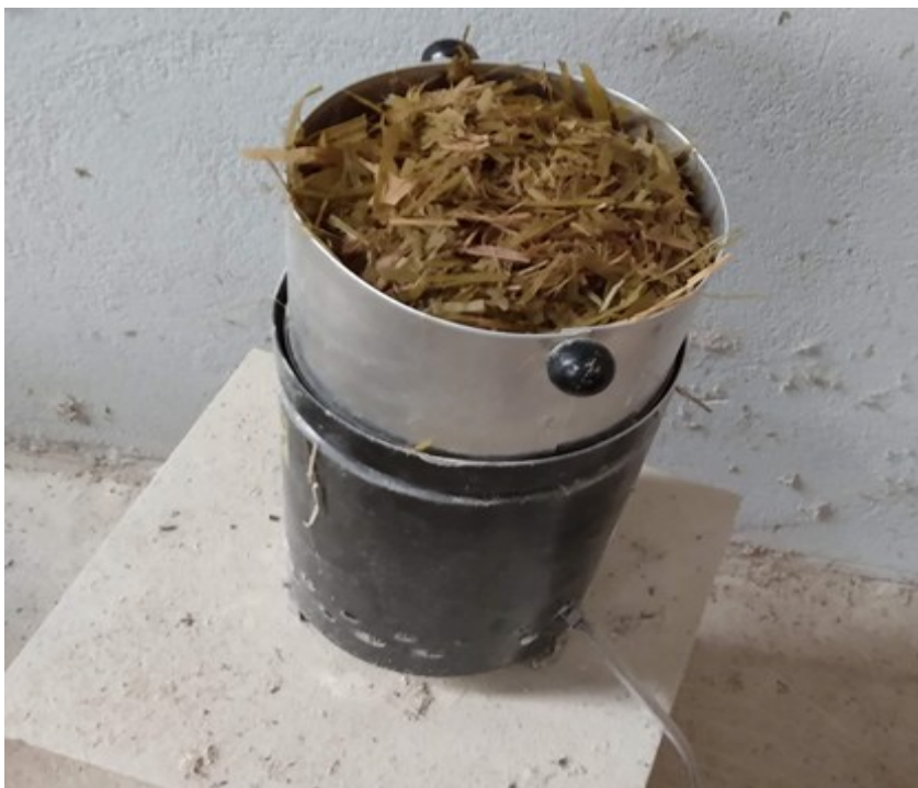
Figura 5. Medidor de umidade Koster.

A determinação da matéria seca da silagem foi calculada da seguinte forma: