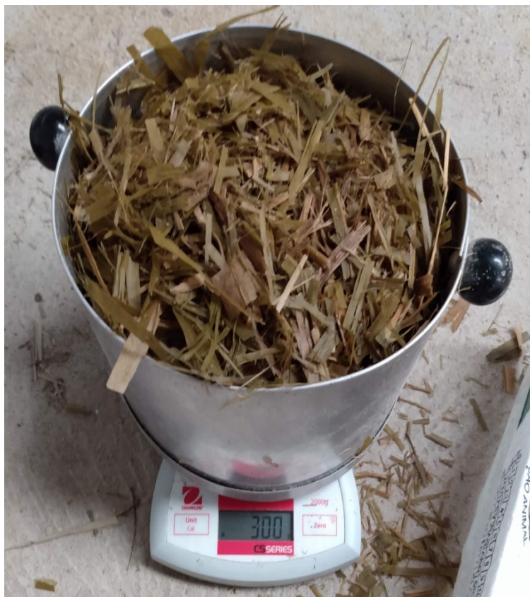
Figura 4. Pesagem da amostra de silagem após a tara da vasilha.

coletar a amostra de silagem no silo, acondicionar em saco plástico e enviar para a fábrica de ração. Em sequência, o material era homogeneizado, pesado (amostra de 300 g) e colocado no equipamento para secar, sendo feitas novas pesagens a cada hora até que se tivesse o peso estabilizado (Figuras 4 e 5).