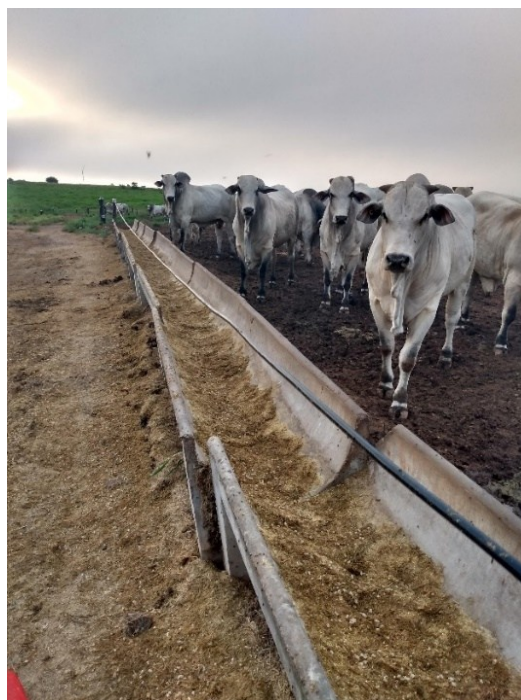
Figura 2. Animais confinados

O confinamento constitui-se de duas linhas, sendo uma com dez e outra com três currais, totalizando 13 currais, a área total do confinamento é de 5000 m 2 , com capacidade para 500 animais. Durante o período de estágio foi possível acompanhar o confinamento de 393 tourinhos Nelore com idade média aproximada de 30 meses e peso médio inicial de 580 kg (Figura 2).