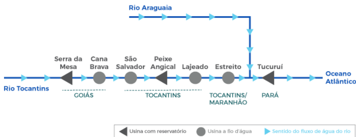
Figura 2 - Diagrama esquemático de hidrelétrica da bacia hidrográfica do Rio Tocantins.

Nessa perspectiva, no rio Tocantins são instalados grandes e importantes usinas hidrelétricas no território nacional, sendo, respectivamente, a da Serra da Mesa, de Cana Brava, em Goiás; de São Salvador, de Peixe Angical e de Lajeado, no Tocantins; de Estreito, no Maranhão, e de Tucuruí, no Pará, onde juntas, produzem um potencial de energia elétrica no rio de cerca de 11.500 MW, o que representa o terceiro maior do Brasil (BRASIL, 2022). O esquema das hidrelétricas no rio Tocantins é apresentado na figura 2.