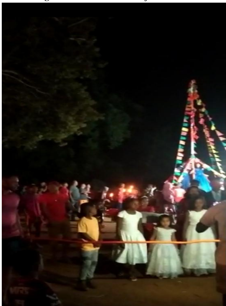
Figura 8 - O mastro do festejo do Divino.