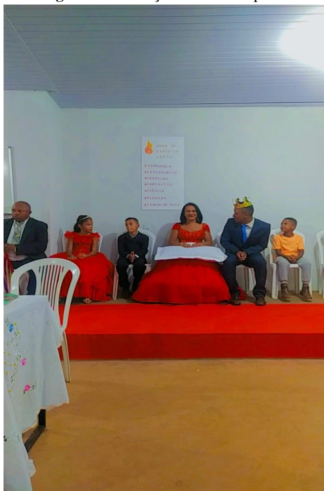
Figura 7 - Coroação do casal imperial