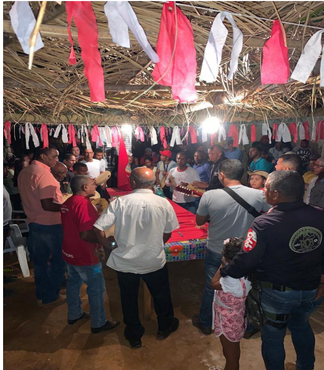
Figura 3 - Foliões entoando do Bendito entorno da mesa