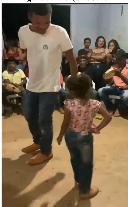
Figura 5 - Dança da Sussa

Após a Roda tem a Sussa é uma dança típica de Folia e presente em muitos festejos religiosos católicos no estado do Tocantins. Dependendo dos foliões e animadores da festa, esse momento pode durar a noite toda e amanhecer o dia. Em outras situações, os foliões descansam para seguir a rotina da tradição: acordar cedo ao som as caixa, beijar a bandeira como forma de saudação e respeito ao Divino e, em seguida, tomar o café da manhã. A Figura 5 mostra a dança da Sussa entre duas gerações, onde as crianças aprendem a entrar na dança desde cedo.