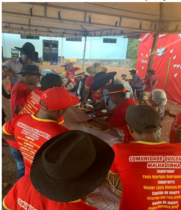
Figura 6 - Retorno da Folia e contando as doações para o Festejo

giro. Segundo alguns foliões, em anos anteriores, o giro foi para a cidade, a área urbana, quando os foliões se deslocam de carro. Assim segue, sucessivamente, até o último dia do giro, que é o dia da festa. No nono dia do giro, a folia chega ao local da festa, a casa do Imperador. A Figura 6 mostra os foliões contando o valor das doações para a realização da festa no retorno da folia.