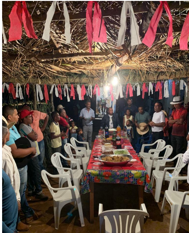
Figura 4 - A mesa de Jantar pronta para os Foliões