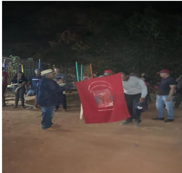
Figura 2 - Chegada da Folia do Divino na Comunidade

Conforme informação dos moradores, a tradição do festejo Divino Espírito Santo na comunidade quilombola Malhadinha ocorre há muitos anos, onde os mesmos estimam que ocorre há mais de 104 anos. Neste ano de 2022 o Festejo aconteceu entre os dias primeiro e nove de julho. A Figura 2 mostra a chegada da Folia do Divino que vai anunciar o início do festejo.