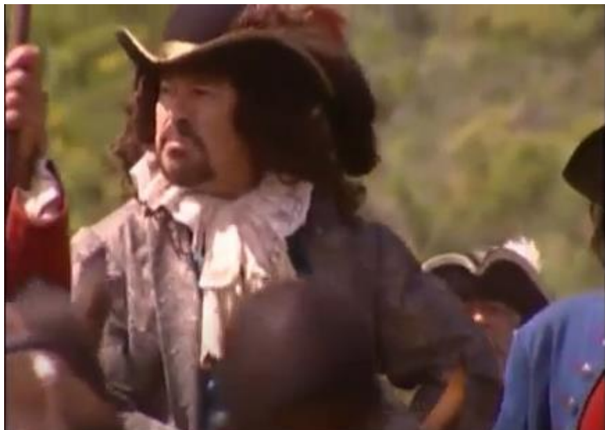
Imagem 12. Chegada do Conde Assumar na vila de Guaratinguetá, enviado pela coroa para descobrir o paradeiro das minas de prata