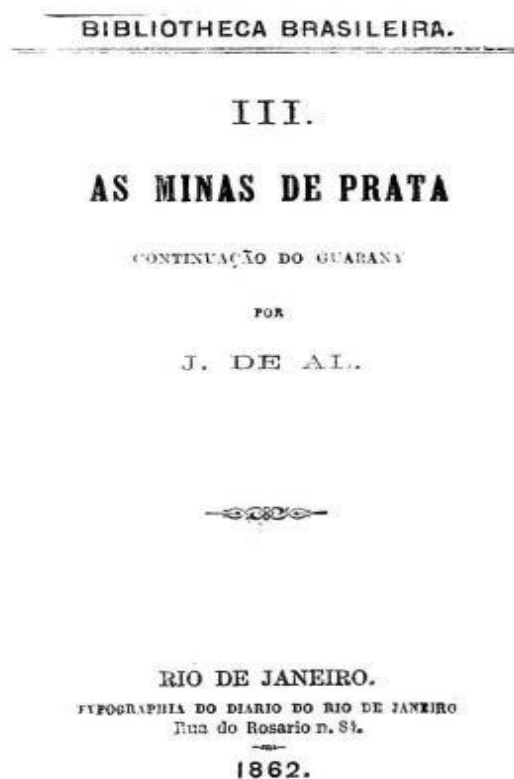
Imagem 5. Capa de lançamento do romance As Minas de Prata (1862)