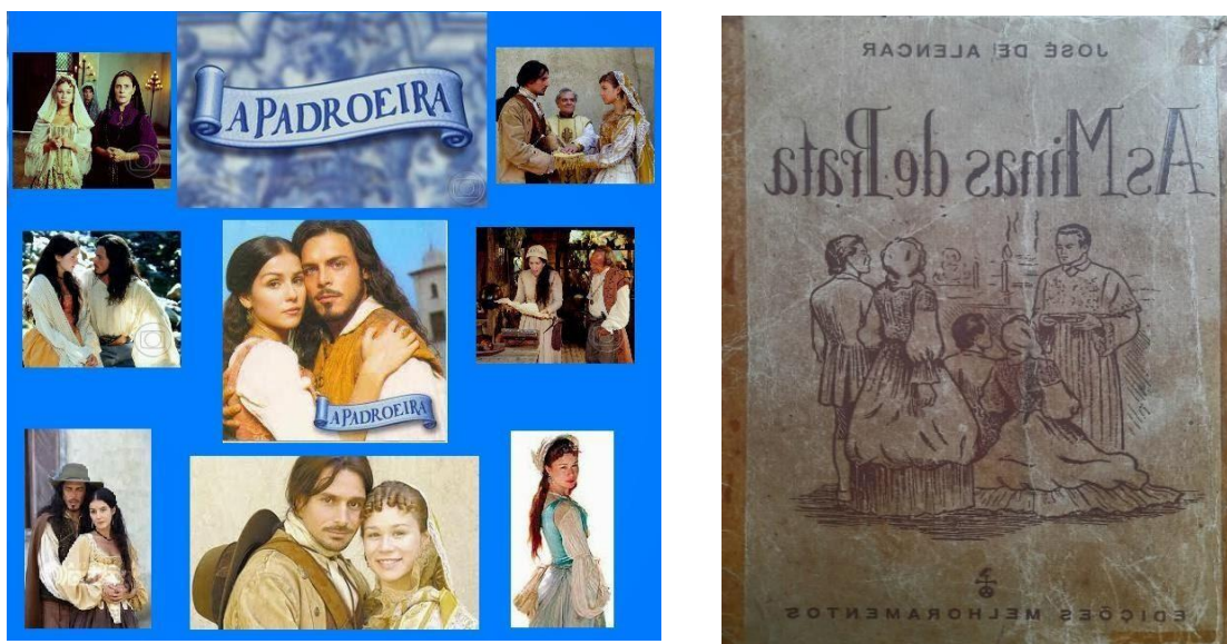
Imagem 1 e 2. Protagonistas de A Padroeira e a capa do romance alencariano