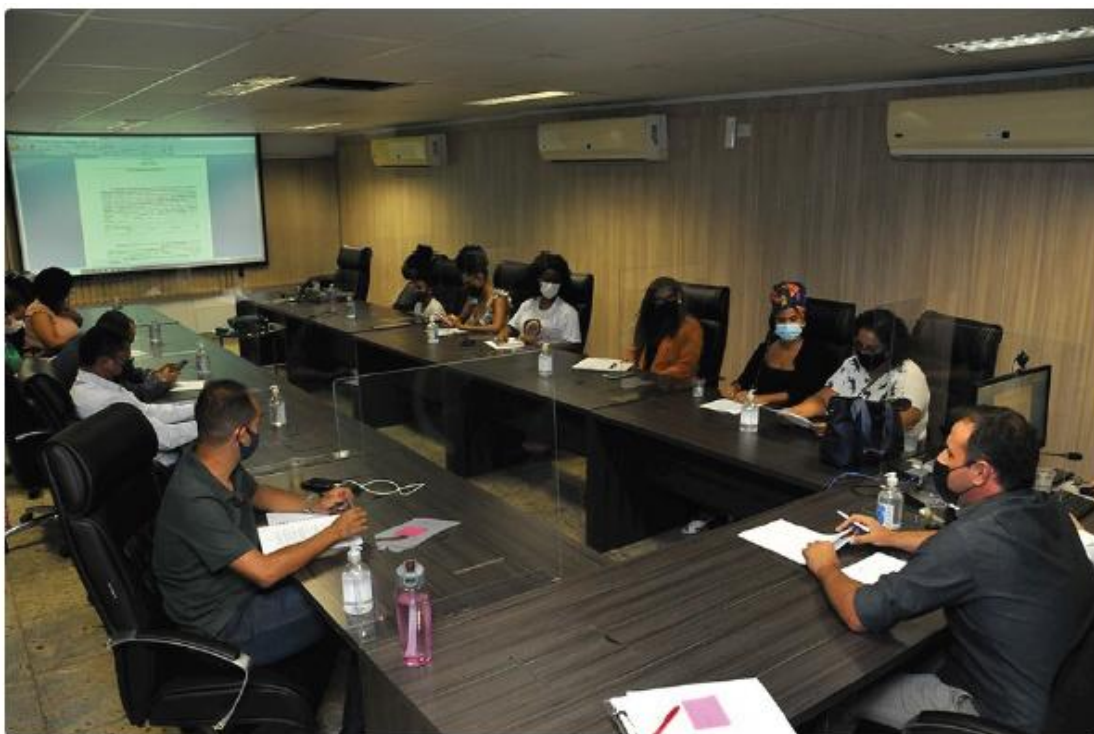
Nucora e movimentos sociais se reuniram na Sala do Conselho Superior da DPE em Palmas

Desde a sua implantação no âmbito da Defensoria Pública, o Núcleo de Questões Étnicas e Combate ao Racismo já realizou atendimentos in loco em sete comunidades quilombolas na região do Jalapão, bem como em aldeias indígenas dos povos Krahô Kanela, na região da ilha do Bananal, no Estado do Tocantins.