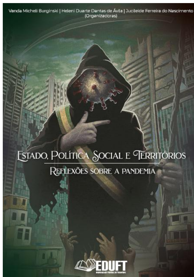
(FIGURA 3. Capa do Ebook “Estado, Política Social e Territórios: reflexões sobre a pandemia)

Também no curso da pesquisa foram organizadas duas mesas redondas para debater a questão quilombola no estado do Tocantins. Com a tônica de buscar compreender a luta pela regularização dos territórios quilombolas no estado do Tocantins, procuramos ouvir profissionais da área e integrantes de comunidades tradicionais para avançar na atuação da Defensoria Pública na defesa dos interesses destes grupos.