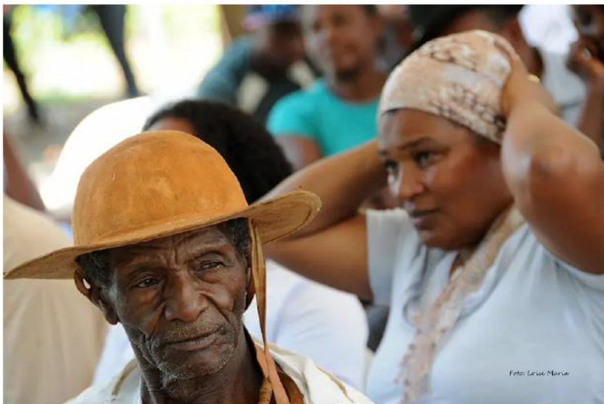
(FIGURA 6. Foto da Exposição “Vida quilombola: laços e povos tocantinenses”, registrada em atendimento do DPE/TO na Comunidade Claro, Prata e Ouro Fino, em Paranã/TO).