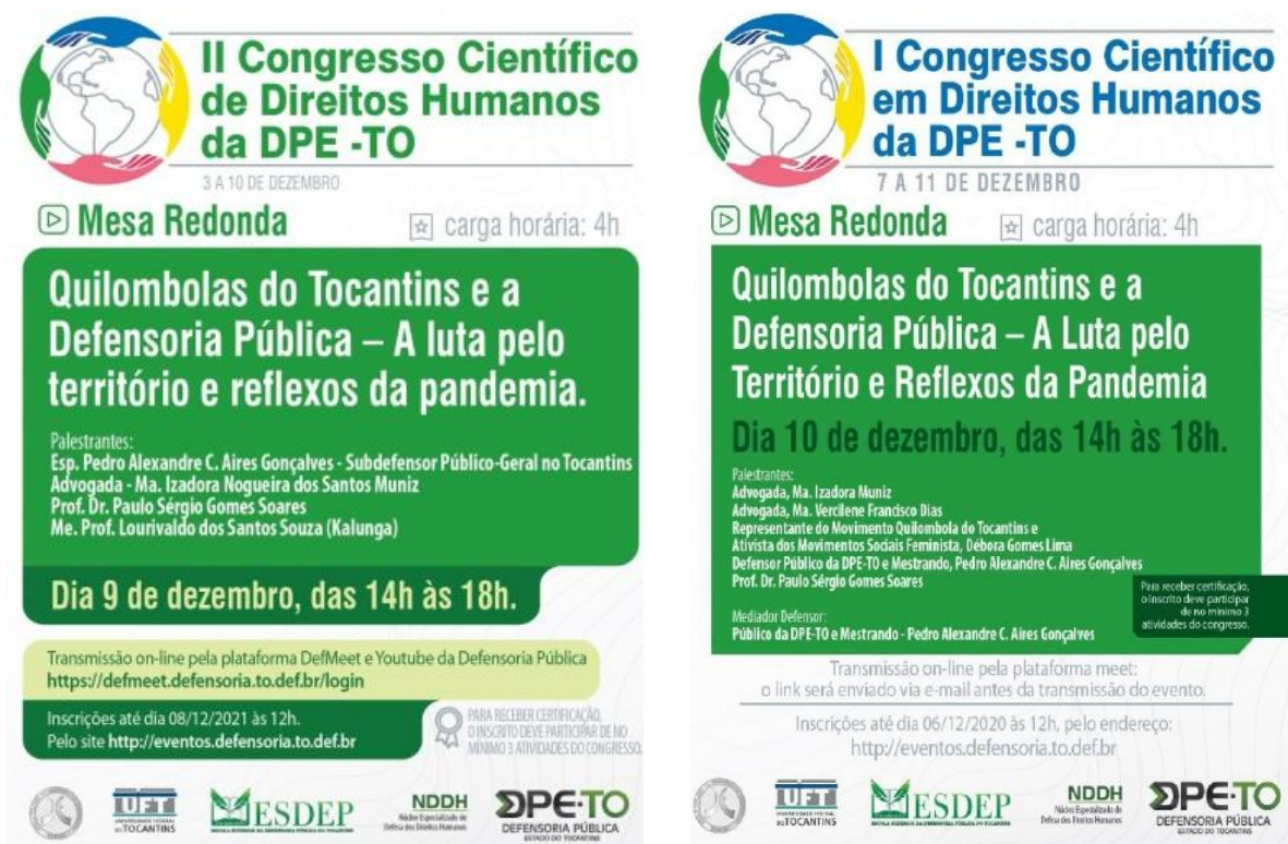
(FIGURA 4. Material de divulgação das Mesas Redondas dos Congressos Científicos da DPE/TO)

Os eventos realizados em dezembro de 2020 e 2021 alcançaram participantes de comunidades quilombolas do Tocantins, líderes de movimentos sociais, acadêmicos e profissionais do sistema de Justiça. As mesas redondas foram transmitidas via youtube https://www.youtube.com/watch?v=XV-pt4y9pV4&t=13631s , tendo mais de 1000 visualizações, e, conforme relatório final do evento confeccionado pela Defensoria Pública do Estado do Tocantins, contando com participantes do Amapá, Distrito Federal, Goiás, Maranhão, Pará, São Paulo, Paraná, Santa Catarina, Sergipe e Tocantins.