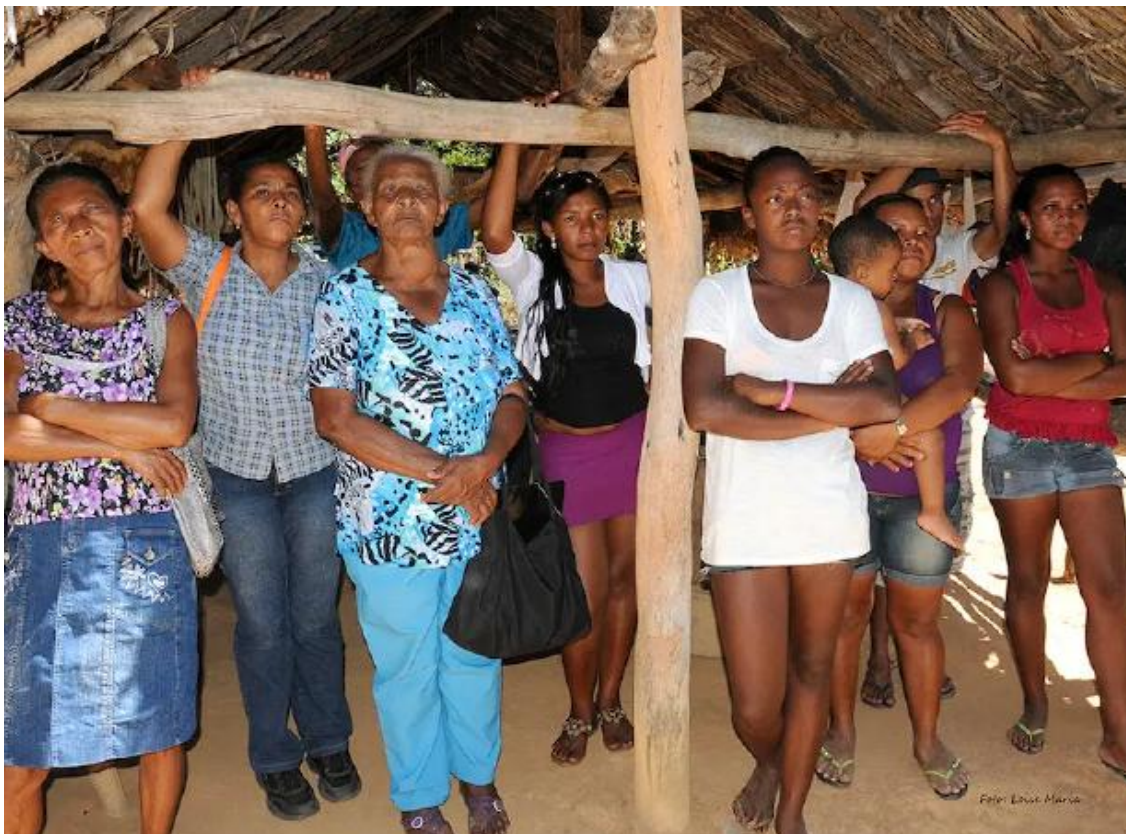
(FIGURA 7. Foto da Exposição “Vida quilombola: laços e povos tocantinenses”, registrada em atendimento da DPE/TO na Comunidade Kalunga do Mimoso, em Arraias/TO).

A mostra fotográfica, tal qual apresentada, contou com grande repercussão no Estado, sendo objeto de matérias jornalísticas na TV, sendo que a principal delas está disponível no seguinte link: https://g1.globo.com/to/tocantins/edicao/2021/02/03/videos-tudo-sobre-o-tocantins.ghtml#video-10761214-id . A exposição também foi divulgada na rádio CBN Tocantins, estando disponível no seguinte link: https://www.cbntocantins.com.br/programas/cbn-tocantins/cbn-tocantins-1.318013/programa-destaca-exposi%C3%A7%C3%A3o-on-line-sobre-vida-quilombola-no-tocantins-realizada-pela-dpe-to-1.2373371 .