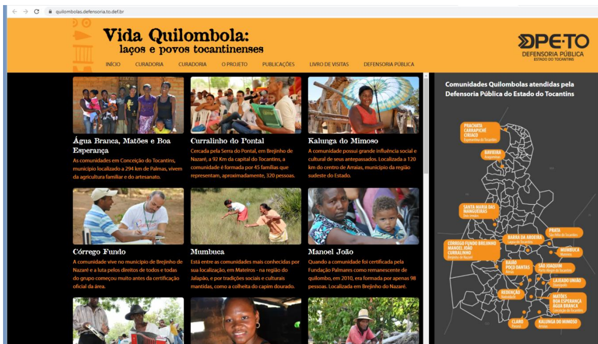
(FIGURA 5. Apresentação da exposição “Vida quilombola: laços e povos tocantinenses”).