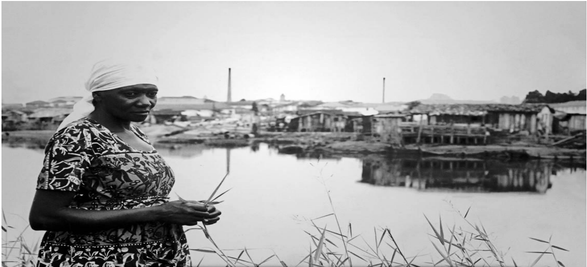
Figura 4 – Favela do Canindé às margens do Rio Tietê, na Zona Norte de São Paulo