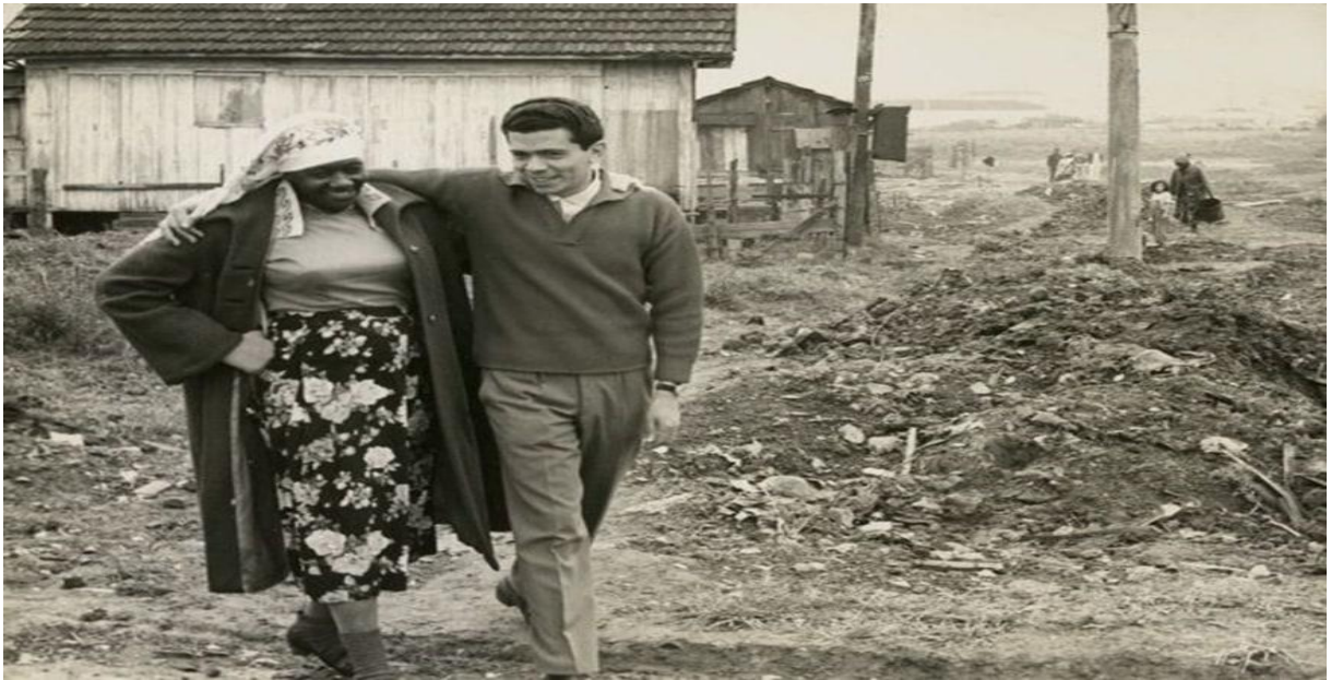
Figura 3. Carolina e o Diário são encontrados pelo jornalista Audálio Dantas na favela do Canindé – São Paulo (Capital)