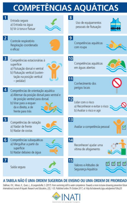
Figura 7 - Compet ncias aqu ticas (Ap ndice C).

para a diminuição do risco de afogamento o reconhecimento da própria competência aquática com roupa, assim como a diferenciação entre a competência aquática em um lugar seguro/controlado piscina, por exemplo e, em águas abertas. Aliás, referem os autores que as diferenças serão, obviamente, menores quando são criadas oportunidades de desenvolvimento da competência aquática em contextos diferenciados, de preferência ao ar livre, com água mais fria e com roupa. A capacidade de avaliação pessoal, assim como o reconhecimento de situação de perigo e como ajudar a pessoa em causa são, igualmente, fatores importantes a serem desenvolvidos para a diminuição de acidentes aquáticos. Segue a tabela das 15 competências aquáticas traduzidas pelo Instituto de Nataç o Infantil.