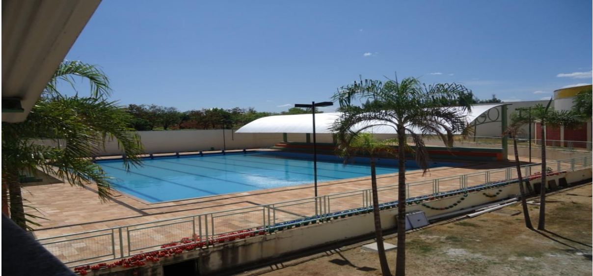
Figura 4 - Piscina de 25 metros.

reservados para as crianças se preparem para as aulas de natação, estão as duas piscinas, uma infantil para a prática de iniciação às atividades aquáticas e outra semi-olímpica geralmente destinada às aulas dos alunos do 5º ao 9º ano, onde será destinada para a intervenção.