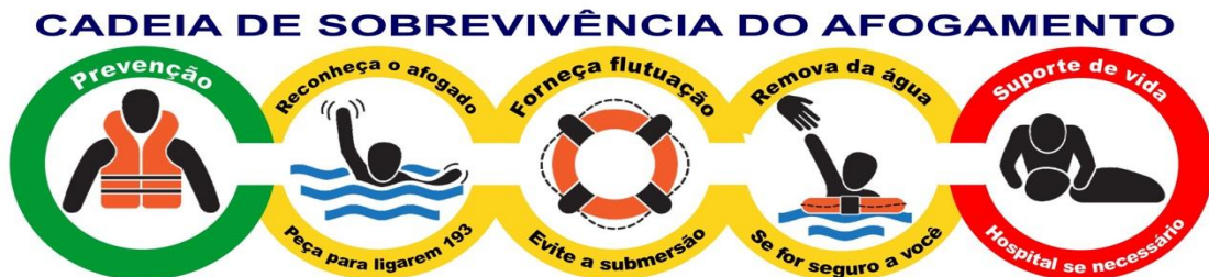
Figura 6 - Cadeia de sobrevivência do afogamento (Apêndice B).

Formas de reconhecer e ajudar outras pessoas com problemas na água sejam introduzidas sequencialmente desde o início, no qual formas seguras e sem contato, apropriadas para o desenvolvimento, de ajudar os outros a partir da terra, sejam ensinadas com a “segurança de si mesmo” primordial em todo o ensino da natação. Em 2013, na Conferência Mundial de Prevenção em Afogamentos, em Potsdam, na Alemanha (WCDP 2013), com a presença de especialistas de 19 países criaram uma cadeia específica de sobrevivência do afogamento. Essa cadeia tem um cunho principal na educação de como prevenir e como agir quando houver um afogamento. Veja na figura abaixo: