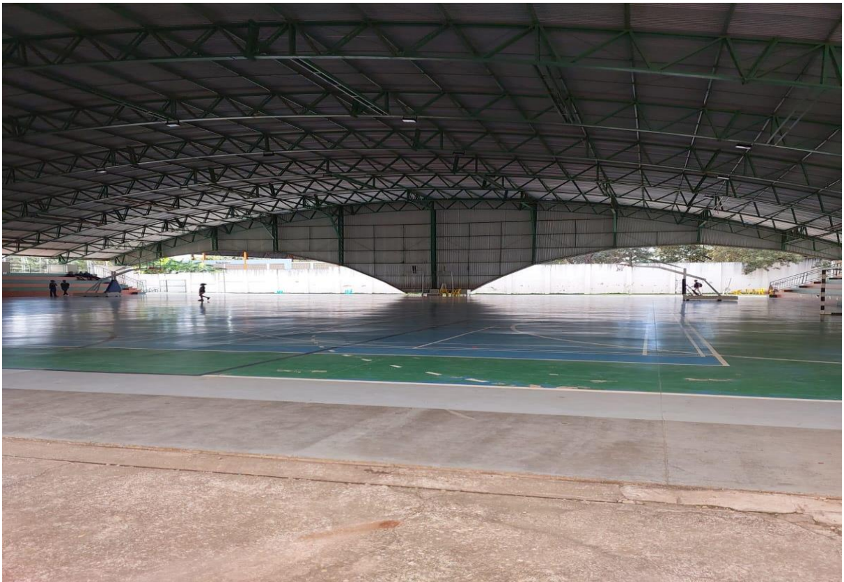
Figura 3 - Quadra Poliesportiva do Bloco de Esportes.

Já no lado oposto ao refeitório está o portão que dá acesso ao bloco de esportes, onde são ministradas as disciplinas de Educação Física, Dança, Natação, Práticas Corporais, Xadrez, sala de material esportivo e coordenação de Educação Física. Na entrada do bloco nos deparamos com um ginásio composto por duas quadras poliesportivas, onde são ministradas as aulas de Educação Física.