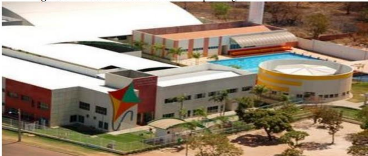
Figura 2 - Vista Aérea da Escola de Tempo Integral Padre Josimo Tavares.