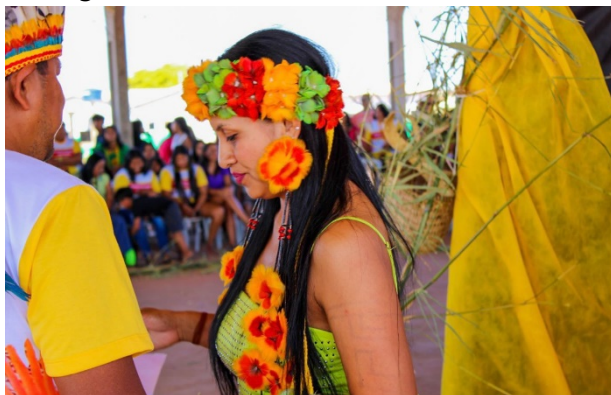
Fig.1 Neudvania Onaezokenazokaerose