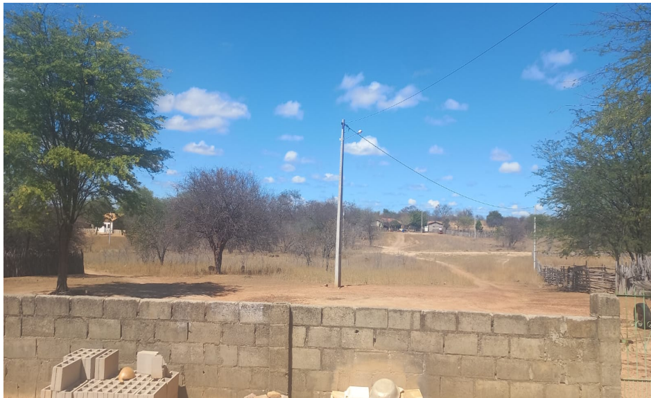
Figura 3: Área Central da Comunidade